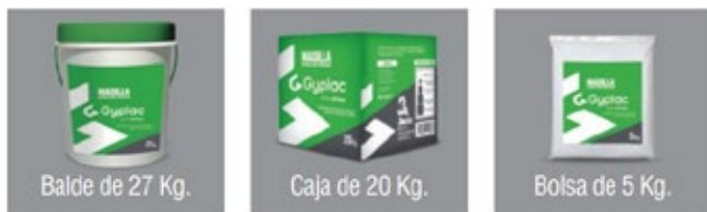
Balde de 27 Kg.